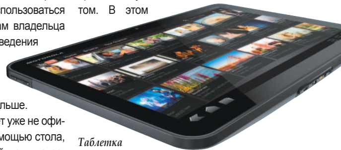
Таблетка Motorola Xoom

Android-таблетка Xoom от Motorola Mobility с 10,1" экраном на выставке была признана лучшим гаджетом. В этом