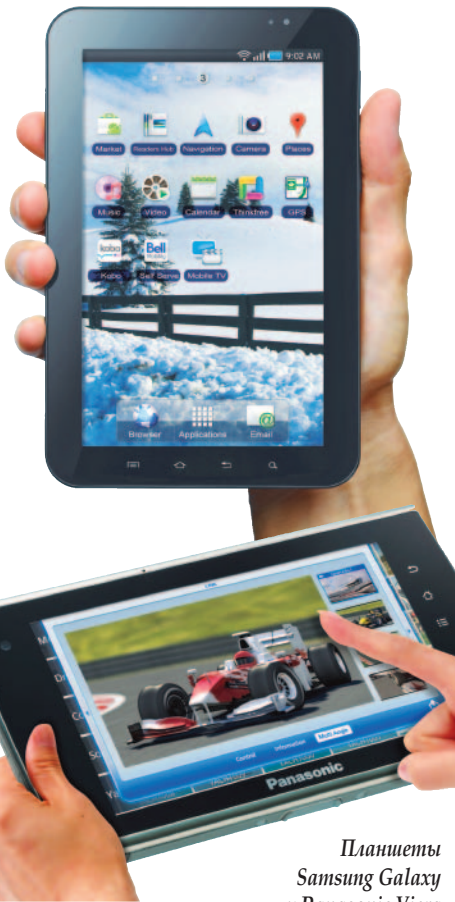
Планшеты Samsung Galaxy и Panasonic Viera

др. Стоит отметить, что многие производители рассчитывают на операционную систему Google Android 3.0, хотя на момент работы выставки официально она не была презентована.